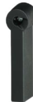
Рукоятка SIRCO VM1 и VM2.