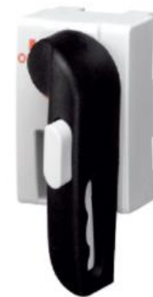
Рукоятка SIRCO VM0.